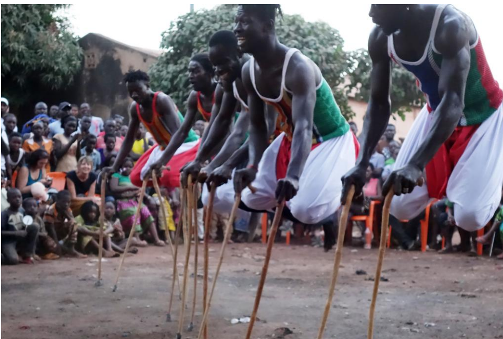
PARADE DU FESTIVAL BOLO'ARTS AVEC LES ENFANTS ET LES JEUNES DANSEURS DE KATOUMA

https://farafidanza.wordpress.com/2016/02/17/atelier-pour-enfants-ankili-so-deni/